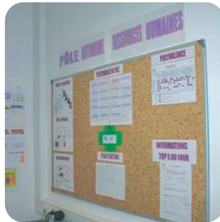
Exemple de panneau GAP aux Ressources Humaines à Saverne

7 types de gaspillages génériques qu'il convient de transformer en économie, c'est à dire de les supprimer pour améliorer l'efficacité du travail et augmenter la part de valeur ajoutée.