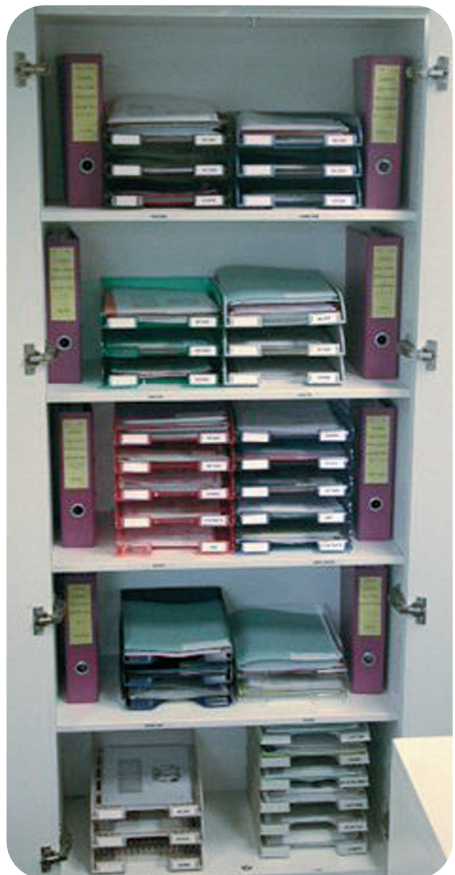
Exemple de standardisation des postes de travail à la Comptabilité fournisseurs et immobilisations à Obernai

• affichage standardisés + TOP Réactivité. Il s'agit de mobiliser l'équipe sur l'atteinte des objectifs SQCDIE (Sécurité, Qualité, Coût, Délai, Implication, Environnement) sur la durée, organiser le travail, faire remonter les problèmes opérationnels et recueillir les Idées d'Amélioration (on appelle Idée d'Amélioration toute proposition qui vise l'amélioration des conditions de travail, des process, de la productivité, de la qualité, des coûts, des délais, de la sécurité et de l'environnement),